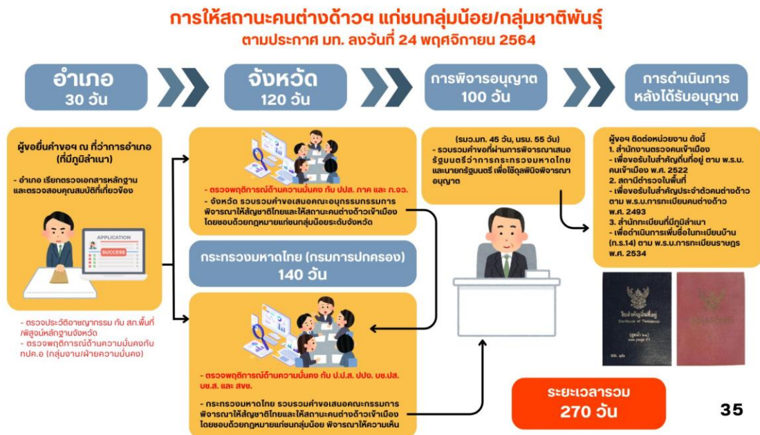
รูปภาพ : ขั้นตอนการขอการดำเนินการให้สถานะคนเข้าเมืองโดยชอบด้วยกฎหมาย

รวมระยะเวลาในการดำเนินการทั้งสิ้น ๑๘๐ วัน