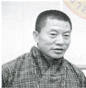
Mr. Pema Needup Presiding Judge (2014 till date)