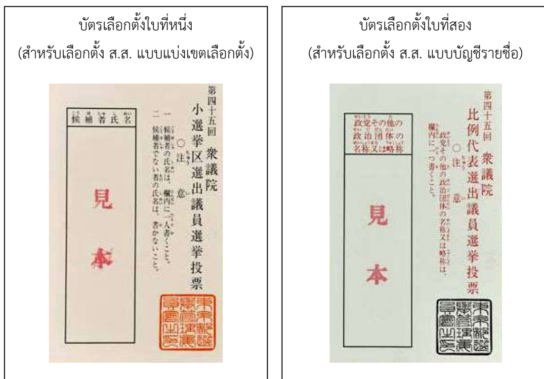
ภาพที่ 4 บัตรเลือกตั้งสมาชิกสภาผู้แทนราษฎร ประเทศญี่ปุ่น 122

เลือกตั้งสมาชิกสภาผู้แทนราษฎรแบบบัญชีรายชื่อ) ต่อจากนั้นผู้มีสิทธิเลือกตั้งจะเข้าคูหา เพื่อกรอกชื่อพรรคการเมืองลงในบัตรเลือกตั้ง และหย่อนบัตรลงในหีบเลือกตั้ง 121