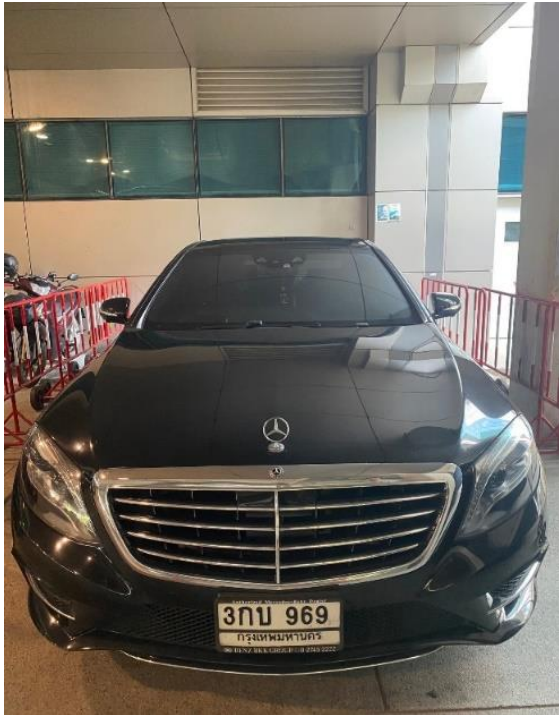
รถยนต์ทะเบียน ๓กบ ๙๖๙ ยี่ห้อ Mercedes-Benz S-Class S๕๐๐ e AMG Premium รุ่นปี ๒๐๑๖